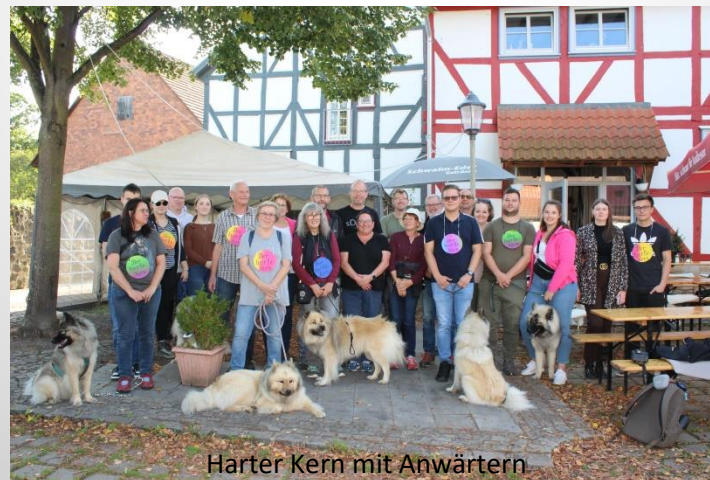
Harter Kern mit Anwärtern

Nach unserem Spaziergang stärkten wir uns in dem Gasthaus „Die Ruthen“. Da das Wetter so schön war, konnten wir im Biergarten sitzen und die Sonne genießen. Nach dem Essen sind wir noch eine kleine Runde gelaufen. Mit Spaß, anregenden Gesprächen und bei Kaffee und Kuchen ließen wir diesen wunderschönen Tag ausklingen.